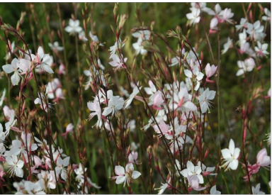
Gaura lindheimeri 'Whirling Butterflies' (gavra 'Whirling Butterflies') višina: 60-80 cm

sajenje po zasaditvenem načrtu med okrasnimi travami