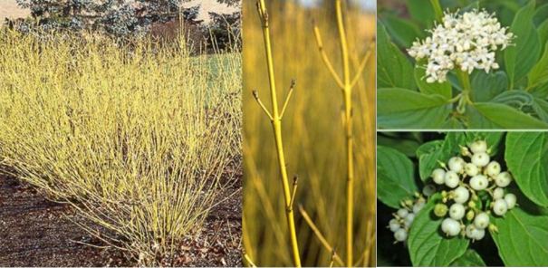
Cornus sericea 'Flaviramea' (svilnati dren) višina/širina: 1,5-3 m