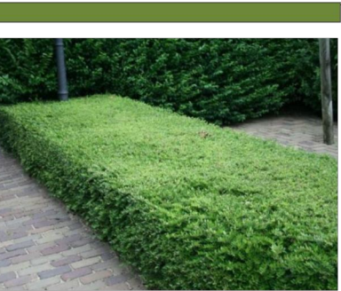
Lonicera nitida 'Maigrun' (mirtolistno kosteničevje 'Maigrun') višina/širina: 60-100 cm

STRIŽENA SREDNJE VISOKA ŽIVA MEJA saditi v linijah s križnim zamikanjem in sadilno razdaljo 30 cm. Zgornji rob 60 cm se zasađi v dveh linijah, zasaditev se nato v delu, kot po načrtu, nadaljuje po brežini navzdol.